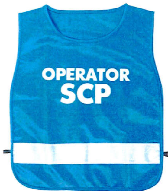
vestă - față