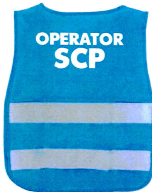
vestă - spate

Descriere: Salariații SCSP vor purta veste din material textil de culoare albastră inscripționate pe față și pe spate